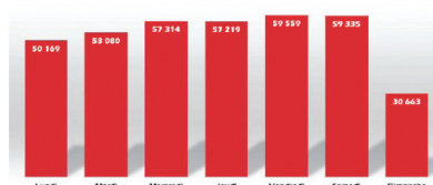
Affluence quotidienne du centre-ville